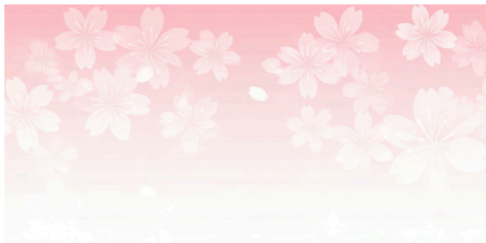
図 1: 画像の説明とかを書く